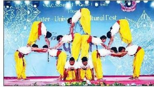
महेंद्रगढ़। स्पंदन-2025 में प्रस्तुतियां देते प्रतिभागी व कार्यक्रम में अपनी प्रस्तुति देते विद्यार्थी।