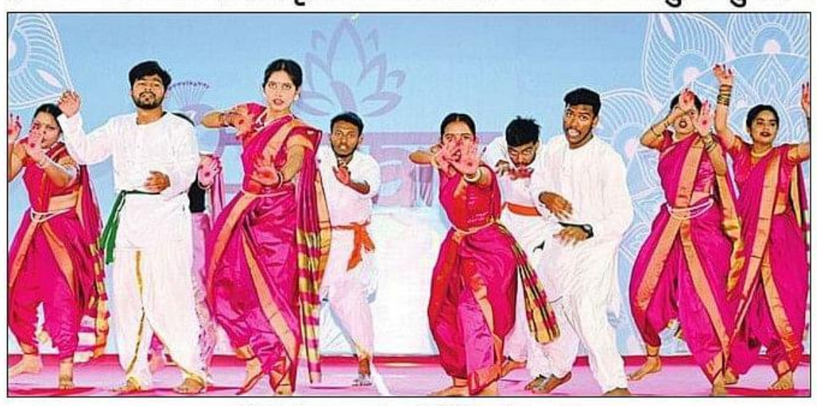
हकेंवि में स्पंदन- 2025 में प्रस्तुति देते प्रतिभागी।

हकेंवि में रविवार से सांस्कृतिक वार्षिकोत्सव स्पंदन का हुआ शुभारंभ