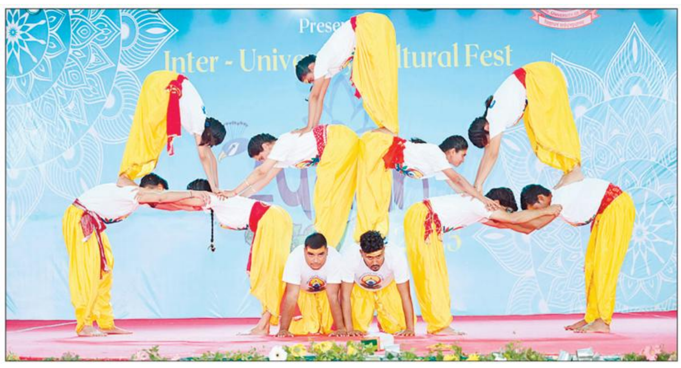
हरियाणा केंद्रीय विवि. महेंद्रगढ़ में आयोजित वार्षिकोत्सव स्पंदन-2025 में प्रस्तुती देते प्रतिभागी।

Newspaper: Navoday Times Date: 10-03-2025